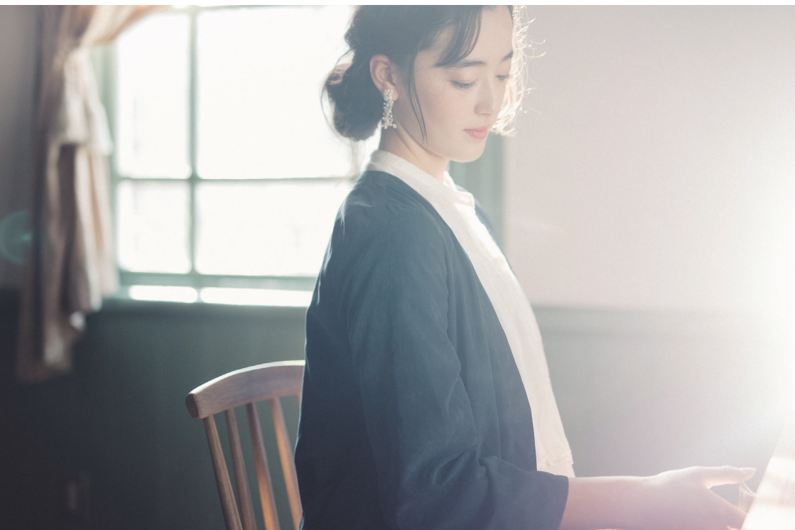
ANEMONE Dresser desk,