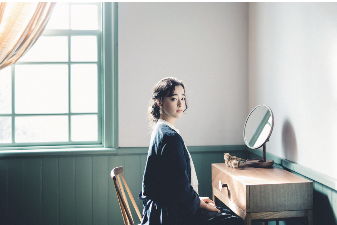
ANEMONE Dresser desk, Vanity mirror