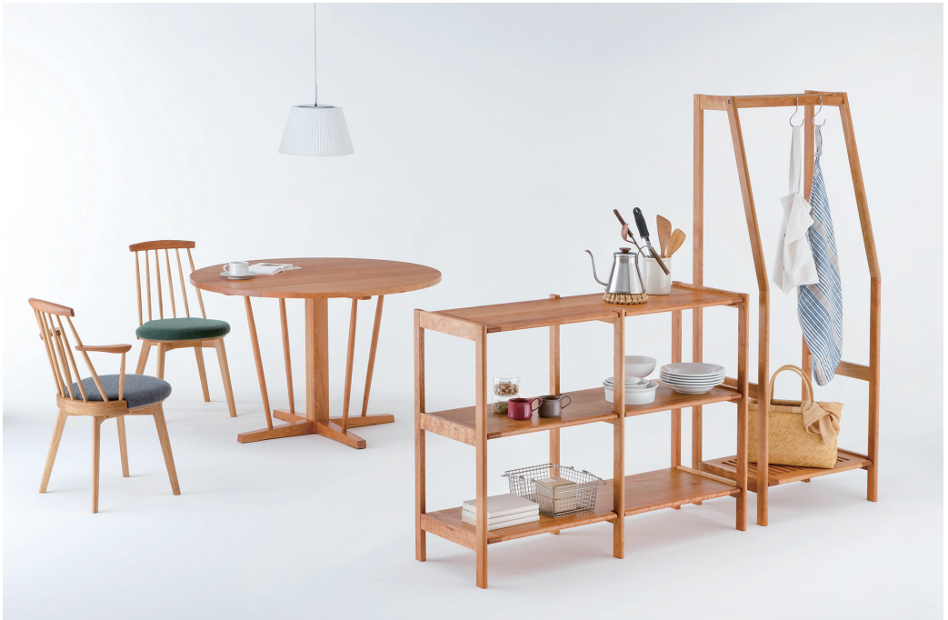
FLAX Hanger rack, Shelf 2x2, JASMINE Dining table circle, Chair H,H arm