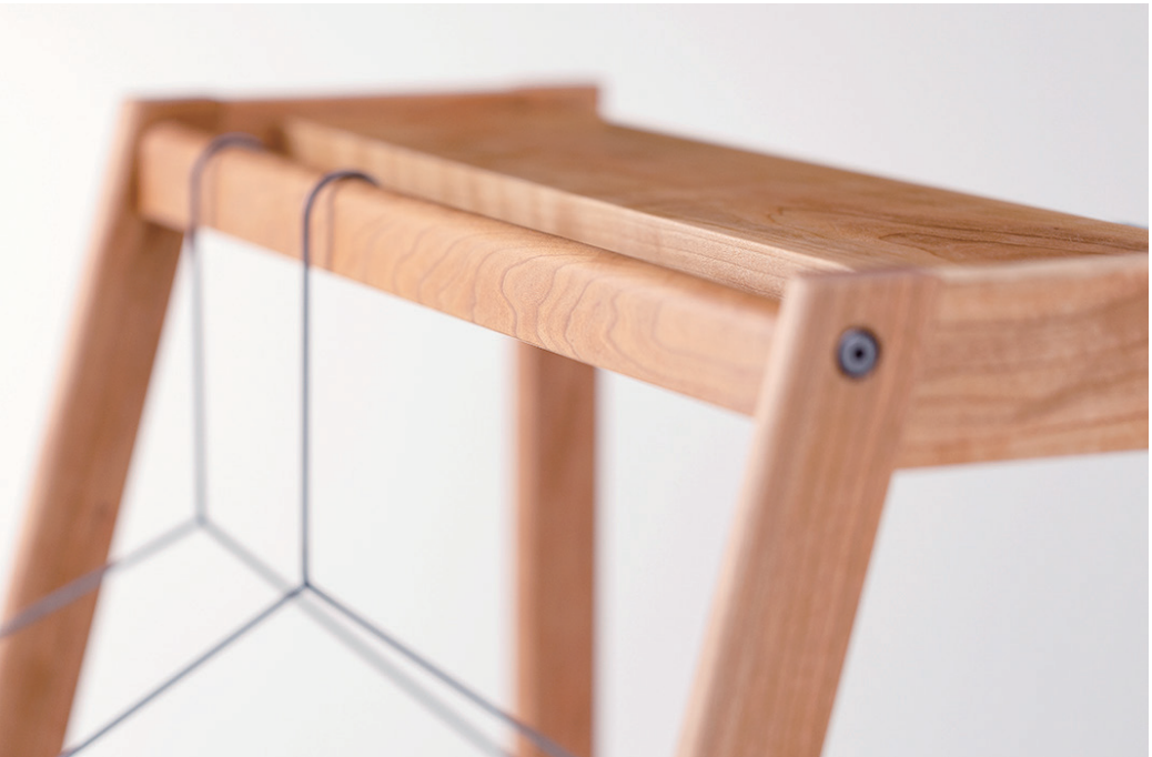
FLAX Hanger rack